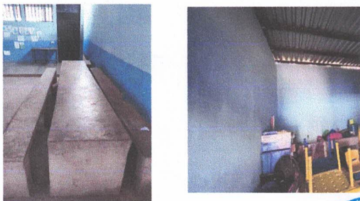
PINTURA EN MUROS EXTERIORES E INTERIORES