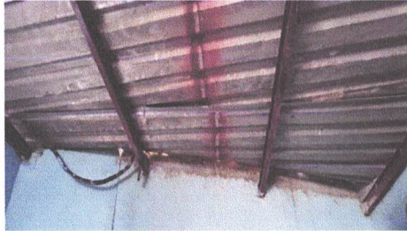
CUBIERTA DE LAMINA