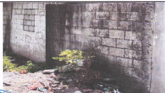
REPARACIÓN DE MURO PERIMETRAL DE BLOCK

Observación: Si es necesario se pueden agregar hojas adicionales y actualizar el número de hojas.