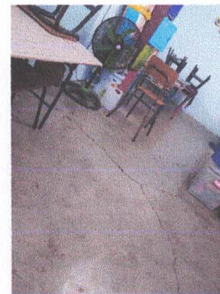
SUSTITUCION DE PISO