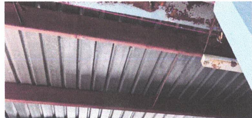
ESTRUCTURA DE TECHO