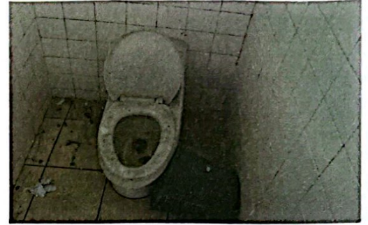
Foto 8 Sustitución de accesorios de inodoro