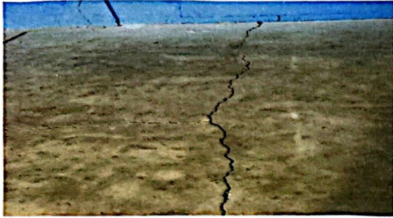
Foto1: Sustitución de torta de cemento dañada, por piso cerámico