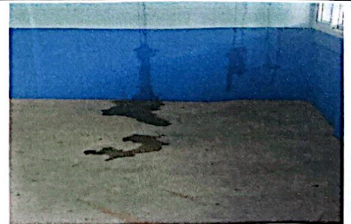
Foto 12: Repello y cermido en paredes, por filtración de agua, interior.

Observación: Si es necesario se pueden agregar hojas adicionales y actualizar el número de hojas.