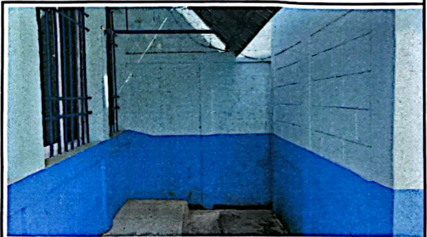
Foto 16: Instalación de tubería PVC línea principal aguas negras.