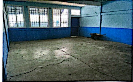
Foto 2: Instalación de mesa de concreto, estantería de cocina y estufa rural