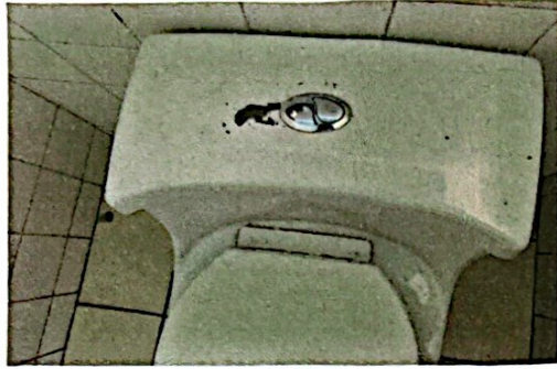
Foto 7 Sustitución de accesorios de inodoro