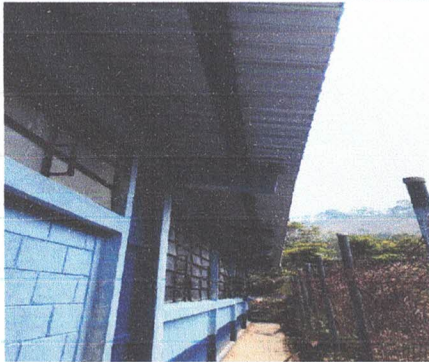
MANTENIMIENTO A PINTURA DE INTERIORES Y EXTERIORES DE PAREDES

Observación: Si es necesario se pueden agregar hojas adicionales y actualizar el número de hojas.