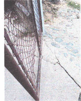
MANTENIMIENTO A ESTRUCTURA METALICA DE PORTÓN