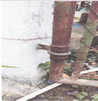
MANTENIMIENTO A ESTRUCTURA DE METAL PORTON