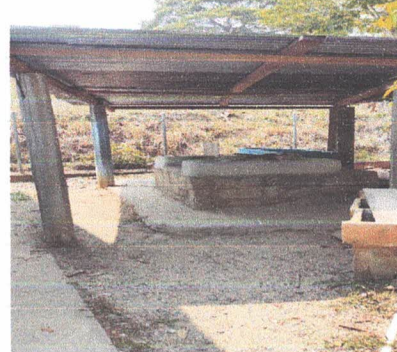
SUSTITUCIÓN DE LAMINA POR LAMINA TROQUELADA CALIBRE 26 Y SOPORTE DE ESTRUCTURA METALICA (COSTANERA)