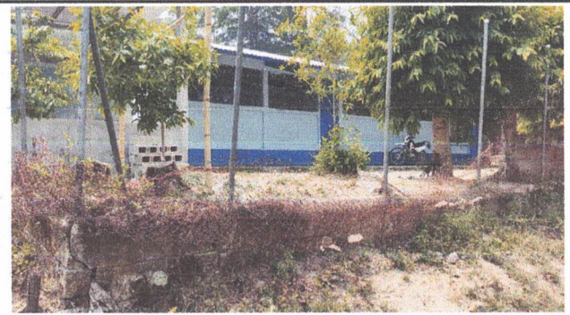
SUSTITUCIÓN O INSTALACIÓN DE MURO PERIMETRAL DE MALLA Y BLOCK

Observación: Si es necesario se pueden agregar hojas adicionales y actualizar el número de hojas.