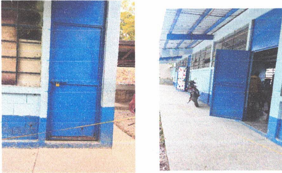
SUSTITUCIÓN DE CHAPAS DE PUERTAS DE METAL