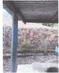
4. SUSTITUCION O REPARACION AREA DE COCINA