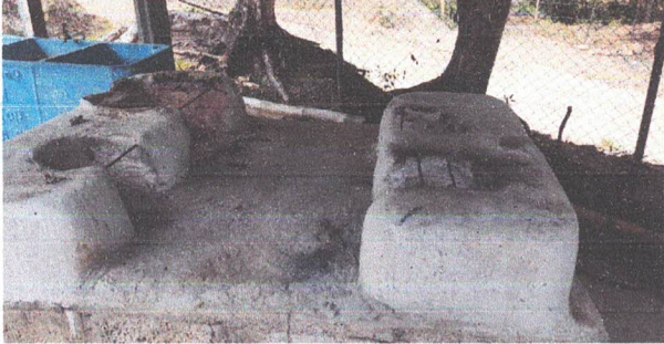
SUSTITUCIÓN DE AREA DE COCINA (INCLUYE POLLETÓN, PLANCHA Y CHIMENEA)