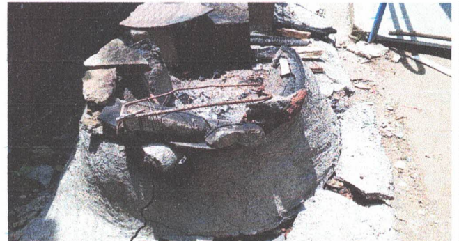
SUSTITUCIÓN DE ESTUFA COMPLETA (INCLUYE POLLETON, PLANCHA DE METAL Y CHIMENEA)