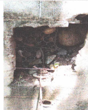
SUSTITUCIÓN DE MURO PERIMETRAL DE BLOCK INCLUYE LA FABRICACIÓN DEL MURO DE CONTENSIÓN POR EL AREA VULNERABLE QUE SE ENCUENTRA LA ESCUELA

Observación: Si es necesario se pueden agregar hojas adicionales y actualizar el número de hojas.