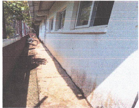
PINTURA EN MUROS INTERIORES Y EXTERIORES