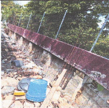
SUSTITUCIÓN DE MURO PERIMETRAL DE BLOCK INCLUYE LA FABRICACIÓN DEL MURO DE CONTENSIÓN POR EL AREA VULNERABLE QUE SE ENCUENTRA LA ESCUELA