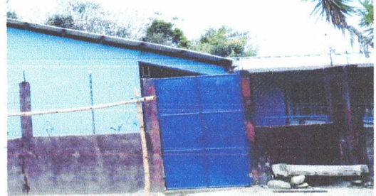
MANTENIMIENTO A ESTRUCTURA DE PORTÓN (LIJADO, CEPILLADO, SUJECIONES Y CAMBIO DE PINTURA