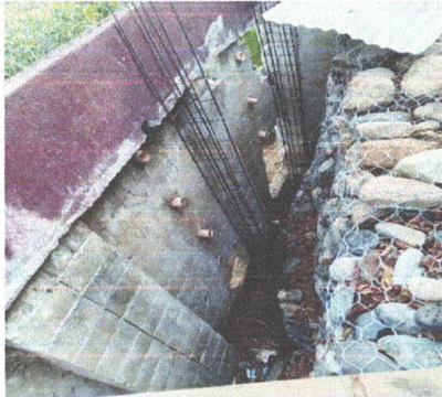
SUSTITUCIÓN DE MURO PERIMETRAL DE BLOCK INCLUYE LA FABRICACIÓN DEL MURO DE CONTENSIÓN POR EL AREA VULNERABLE QUE SE ENCUENTRA LA ESCUELA