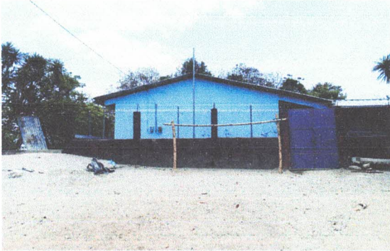
PINTURA EN MUROS EXTERIORES E INTERIORES