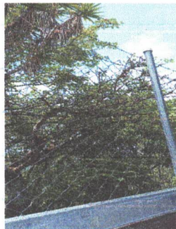
SUSTITUCIÓN DE MALLA POR MURO PERIMETRAL DE BLOCK