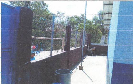
PINTURA EN MUROS INTERIORES Y EXTERIORES