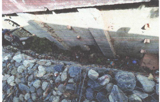
SUSTITUCIÓN DE MURO PERIMETRAL DE BLOCK INCLUYE LA FABRICACIÓN DEL MURO DE CONTENSIÓN POR EL AREA VULNERABLE QUE SE ENCUENTRA LA ESCUELA