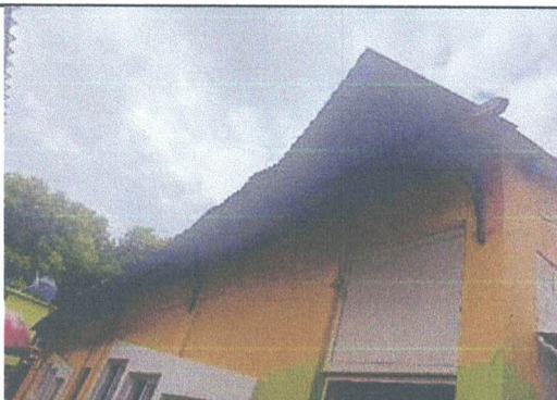
Foto 3: Sustitución e instalación de lámina troquelada y estructura de soporte de metal.