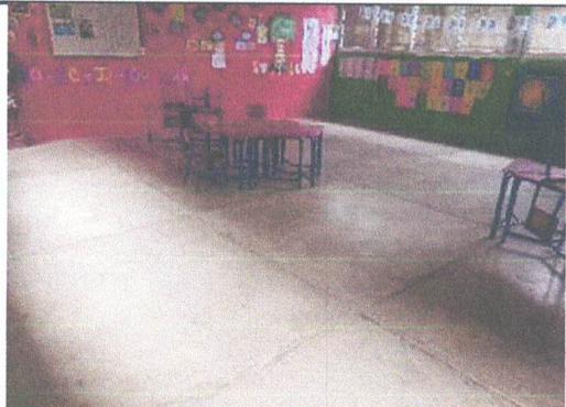
Foto1: Sustitución de torta de piso de concreto por piso cerámico