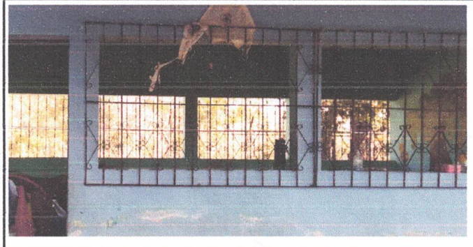
REPARACIÓN DE ESTRUCTURA DE BALCONES

Observación: Si es necesario se pueden agregar hojas adicionales y actualizar el número de hojas.