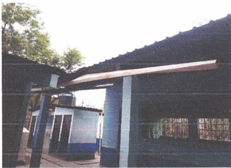
SUSTITUCIÓN DE CANALES DE AGUA PLUVIAL