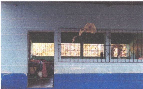
REPARACIÓN DE ESTRUCTURA DE BALCONES