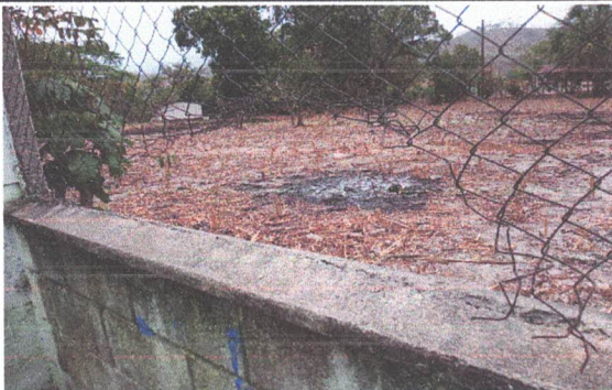
REPARACIÓN DE MURO PERIMETRAL