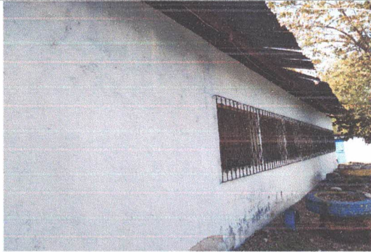
SUSTITUCIÓN DE LAMINA TROQUELADA