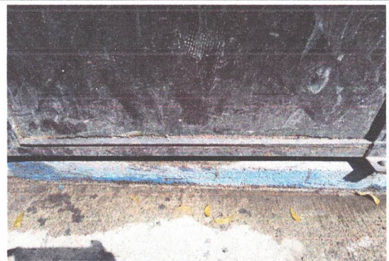
MANTENIMIENTO A PUERTAS DE METAL