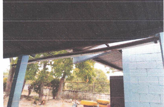
REPARACION DE CANALES DE AGUA PLUVIAL