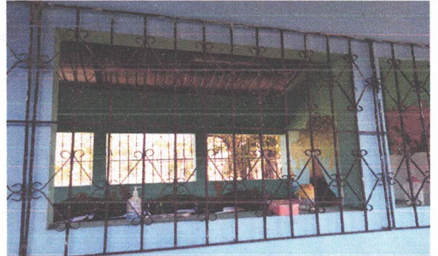
REPARACIÓN DE ESTRUCTURA DE BALCONES