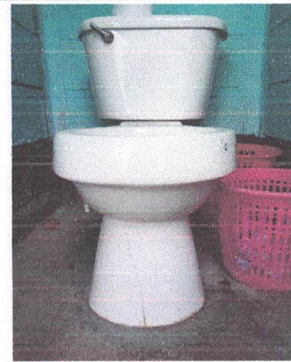
SUSTITUCIÓN DE SANITARIOS Y SUS ACCESORIOS