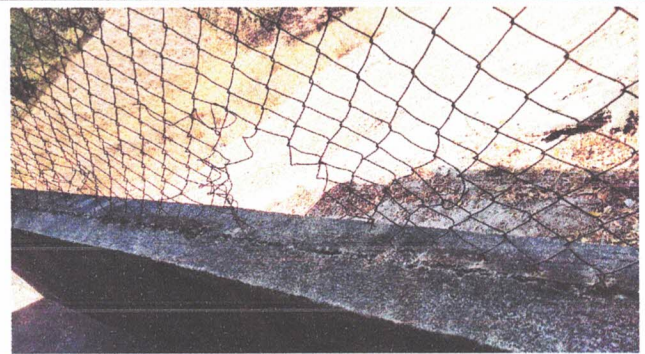
REPARACIÓN DE MURO PERIMETRAL

Observación: Si es necesario se pueden agregar hojas adicionales y actualizar el número de hojas.