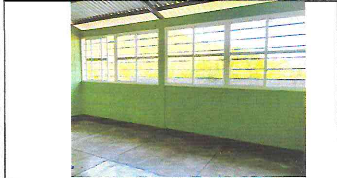
Foto 1: Instalacion de ventanas de PVC, aplicación de pintura y zocalo ceramico.