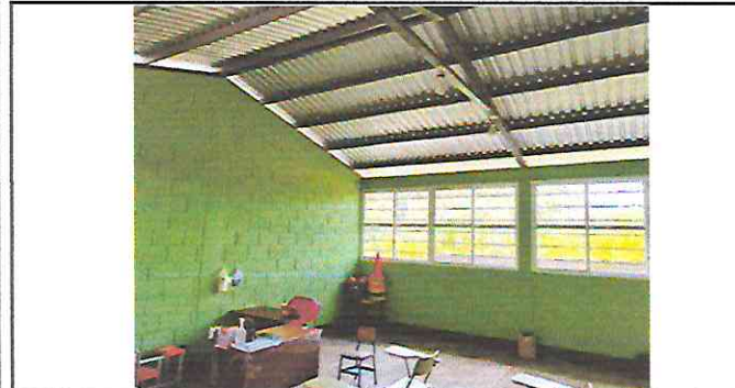
Foto 3: Instalacion de ventanas de PVC, aplicación de pintura, zocalo ceramico y lamina troquelada cal.26.