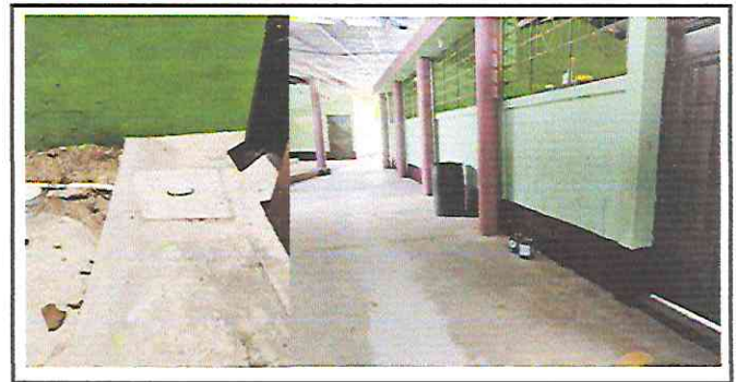
Foto 6: Sustitucion e instalacion de tuberia PVC linea principal de aguas servidas.

Observación: Si es necesario se pueden agregar hojas adicionales y actualizar el número de hojas.