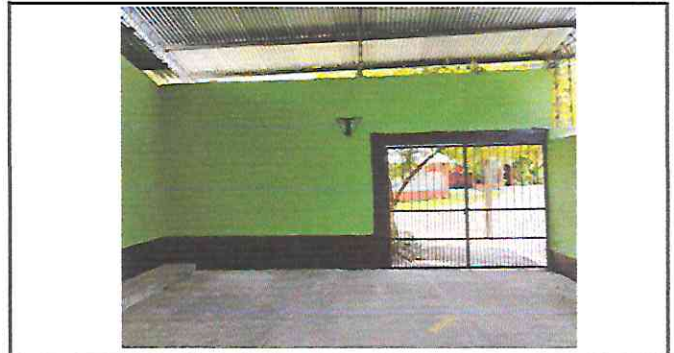
Foto 4: Demolicion de muro para vano de porton y rezanado, pintura y porton de metal.