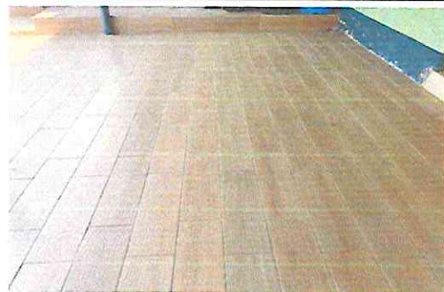
Foto 3.2. Sustitución o instalación de piso de torta de concreto

Observación: Si es necesario se pueden agregar hojas adicionales y actualizar el número de hojas.