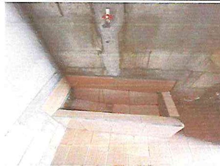
Foto 2.1 Reparación de instalación de mingitorio

Observación: Si es necesario se pueden agregar hojas adicionales y actualizar el número de hojas.