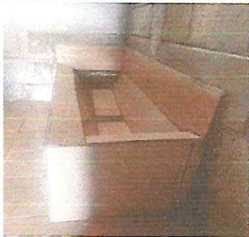
Foto 2.1. Reparación de instalación de mingitorio