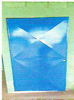
Foto 1.1. Mantenimiento a estructura (lijado, cambio de tubo, cepillado, sujeciones, aplicación de pintura)