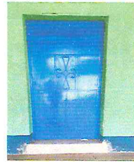
Foto 1.1. Mantenimiento a estructura (lijado, cambio de tubo, cepillado, sujeción aplicación de pintura)