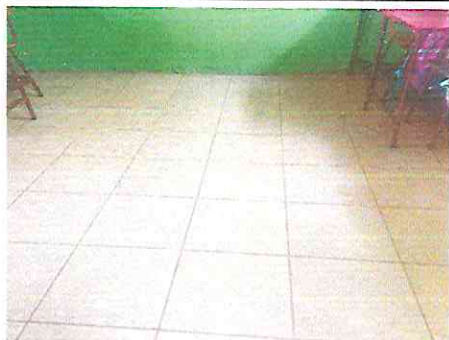
Foto 3.2. Sustitución o instalación de piso de torta de concreto