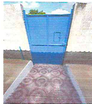
Foto 3.1. Sustitucion o instalacion de portón de metal