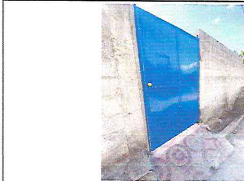
Foto 3.1. Sustitución o instalacion de portón de metal