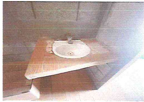
Foto 2.2. Mueble de concreto para instalacón de lavamanos acabado de concreto