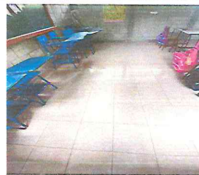
Foto 1.2. Sustitución o instalación de piso cerámico