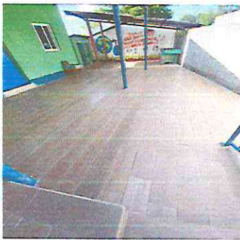
Foto 1.2. Sustitución o instalación de piso cerámico