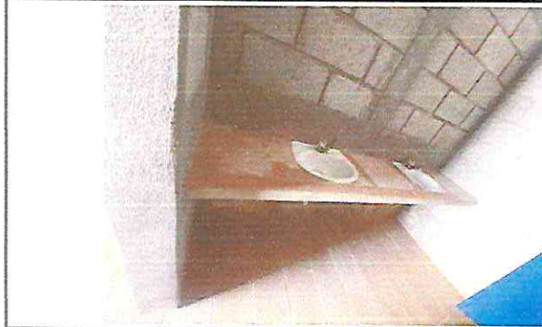
Foto 2.2. Mueble de concreto para instalacón de lavamanos acabado de azulejo