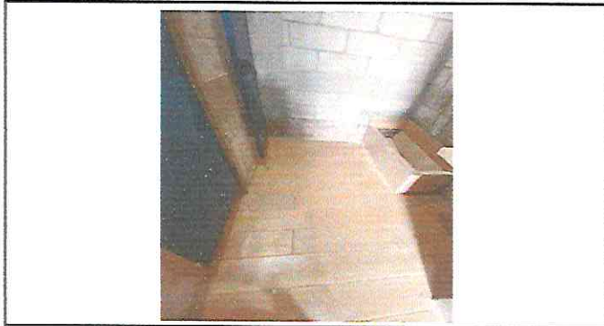
Foto 2.1. Reparación de instalación de mingitorio