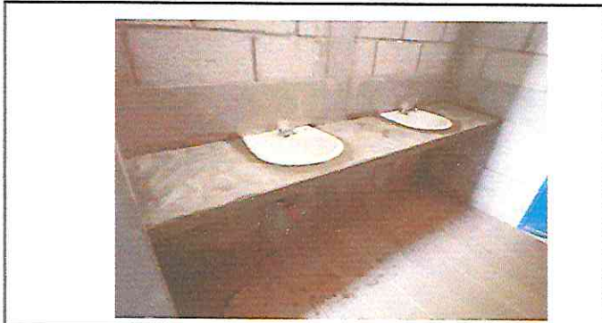
Foto 2.2. Mueble de concreto para intalación de lavamanos acabado de azulejo