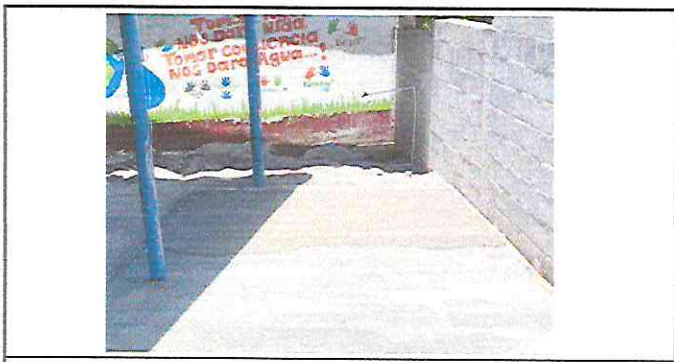
Foto 3.2. Sustitución o instalación de piso de torta de concreto