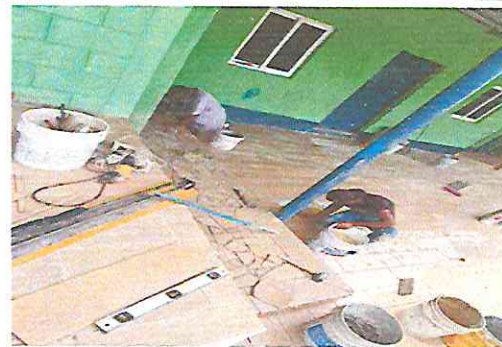
Foto 1.2. Sustitución o instalación de piso cerámico