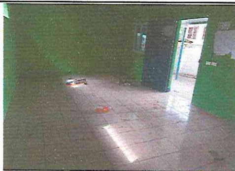
Foto 1.2. Sustitución o instalación de piso cerámico