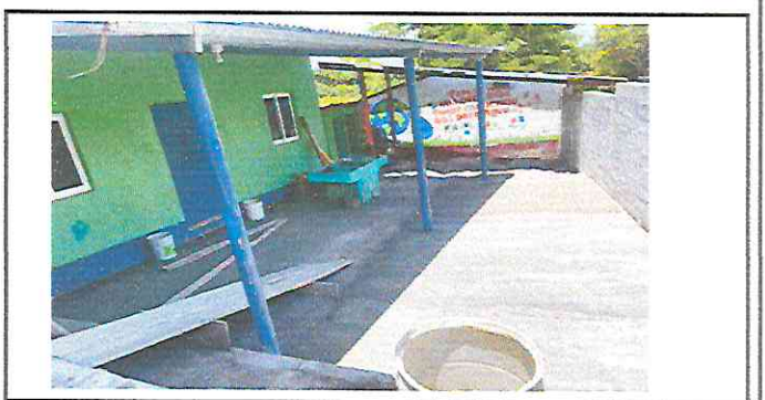
Foto 3.2. Sustitución o instalación de piso de torta de concreto

Observación: Si es necesario se pueden agregar hojas adicionales y actualizar el número de hojas.