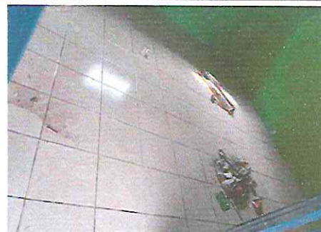
Fo1.2. Sustitución o instalación de piso cerámico

Observación: Si es necesario se pueden agregar hojas adicionales y actualizar el número de hojas.