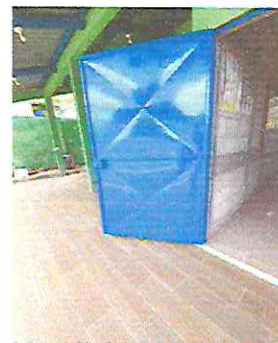
Foto 1.1. Mantenimiento a estructura (lijado, cambio de tubo, cepillado, sujeción aplicación de pintura)