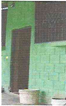
Foto 1.1. Mantenimiento a estructura (lijado, cambio de tubo, cepillado, sujeciones, aplicación de pintura)