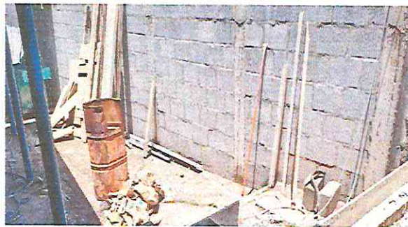
Foto 1.2. Sustitución o instalación de piso cerámico