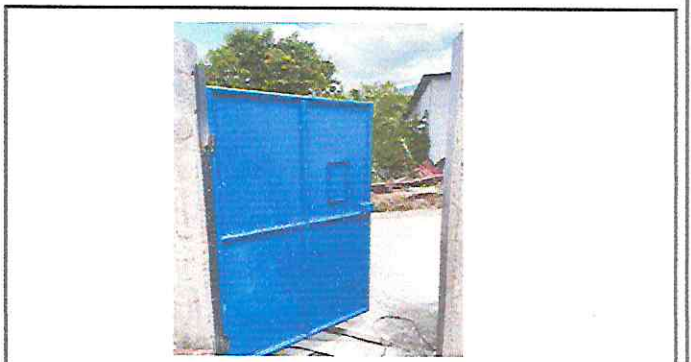
Foto 3.1. Sustitucion o instalacion de portón de metal