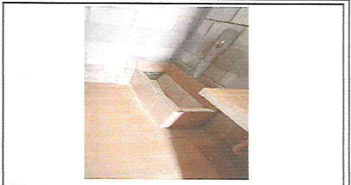
Foto 2.1. Reparación de instalaciones de mingitorio