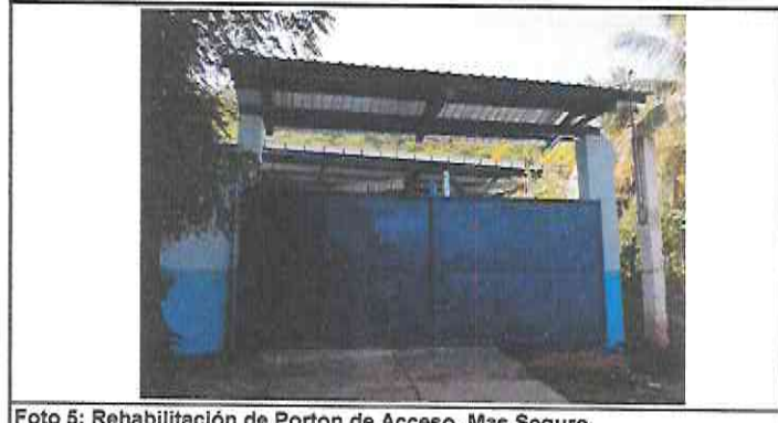
Foto 5: Rehabilitación de Porton de Acceso. Mas Seguro. (REMOZAMIENTO TERMINADO)