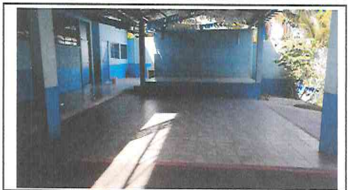
Foto 4: Sustitución de Piso Ceramico en Patio entre Escenario y Aulas. (REMOZAMIENTO TERMINADO)