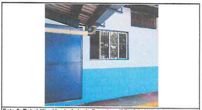
Foto 6: Rehabilitación de Aula de Parvulos. (REMOZAMIENTO TERMINADO)

Observación: Si es necesario se pueden agregar hojas adicionales y actualizar el número de hojas.