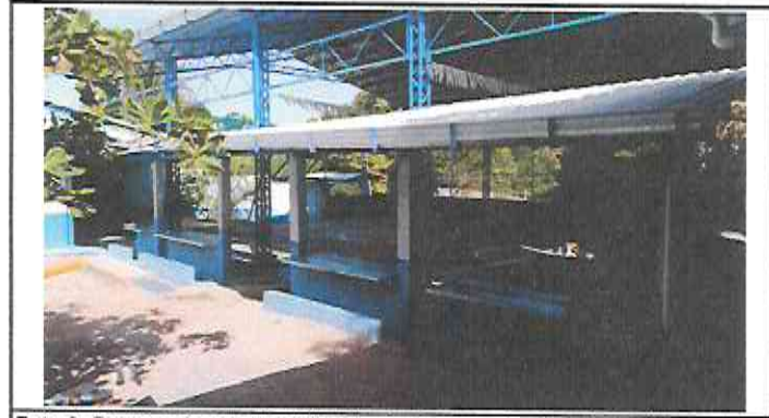
Foto 3: Reparación y Rehabilitación de Techo entre Cancha Polideportiva y Área de Juegos. (REMOZAMIENTO TERMINADO)