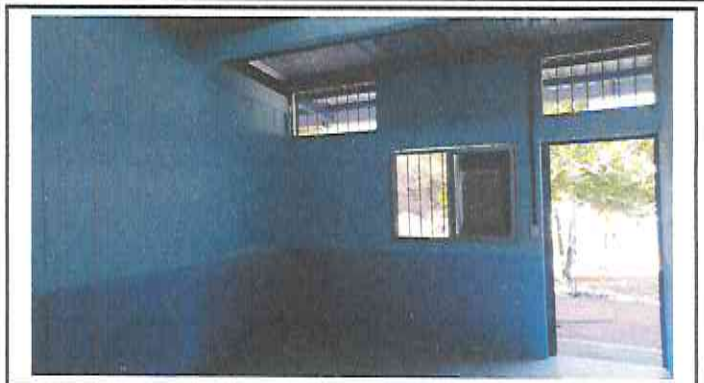
Foto 2: Rehabilitación y Ampliación de Aula de Parvulos. (REMOZAMIENTO TERMINADO)