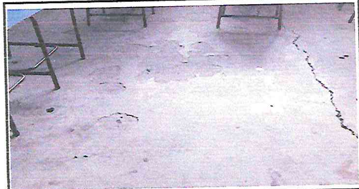
DEMOLICIÓN DE TORTA (PISO) EN AULAS POR ENCONTRARSE CON GRIETAS Y LEVANTANDO DE LA PASTA DE DE CEMENTO