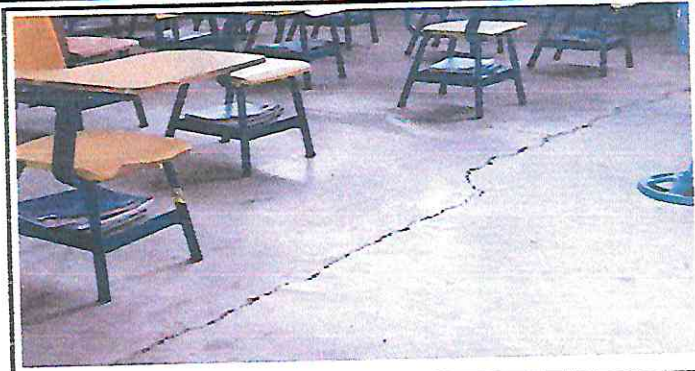
DEMOLICIÓN DE TORTA (PISO) EN AULAS POR ENCONTRARSE CON GRIETAS Y LEVANTANDO DE LA PASTA DE DE CEMENTO