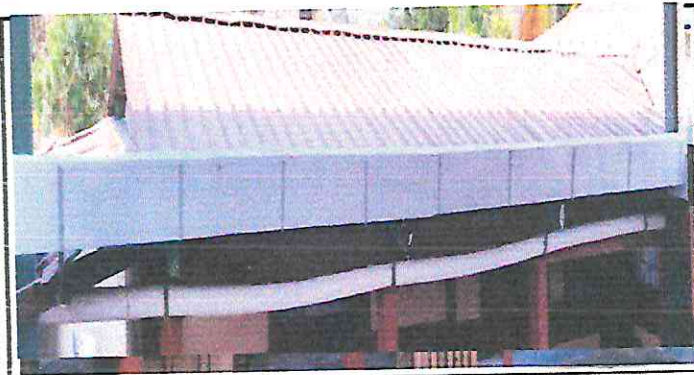
SUSTITUCIÓN DE BAJADA DE AGUA PLUVIAL POR CANAL DE METAL POR MOTIVO DE TENER FUGAS