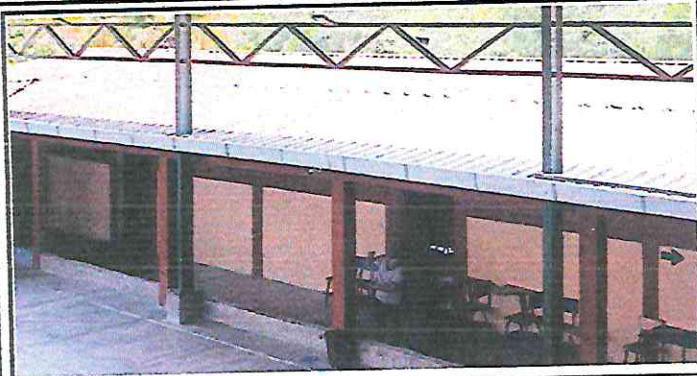
SUSTITUCIÓN DE LÁMINAS EN AULAS POR ENCONTRARSE OXIDADAS Y PICADAS, POR LAMINAS TROQUELADAS DE ALUZINC CALIBRE 26.