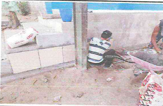
FOTO 5: Mantenimiento de paredes, colocación de piso (frente a escenario), pintura en paredes exterior e interior.