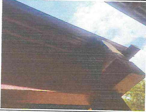
FOTO 1: Sustrucción de instalación de lámina por lámina troquelada zinc calibre 26