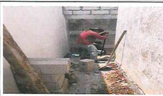
Foto 2.3 y 2.4: Instalación de base de estructura metálica para instalación de Tanque de agua