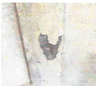
FOTOGRAFIA: REPELLO + SANITIZACIÓN EN MUROS CERNIDO EN MUROS, PINTURA EN MUROS.