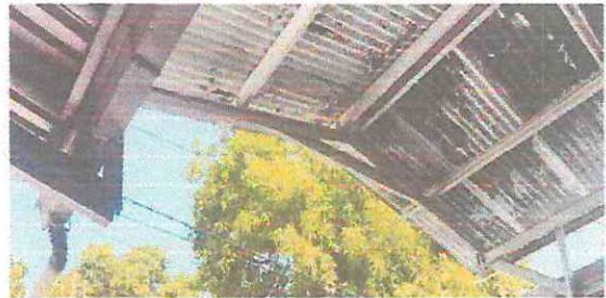
FOTOGRAFÍA: SUMINISTRO INSTALACION DE LAMINA CALIBRE 26 + SUMINISTRO INSTALACION ELECTRICA EN AREA CIVICA.

Observación: Si es necesario se pueden agregar hojas adicionales y actualizar el número de hojas.