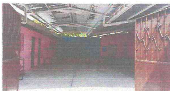
FOTOGRAFIA: SUSTITUCIÓN DE LAMINA TROQUELADA CALIBRE 26, SUMINISTRO E INSTALACION ELECTRICA DE TECHO EN ÁREA CIVICA ( 8 PLACAS CON SUS BOMBILLAS DE 100 W INCLUYE CABLE ELECTRICO, 8 TOMACORRIENTES DISTRIBUIDOS EN EL ÁREA CIVICA INCLUYE CABLE ELECTRICO, 2 APAGADORES TRIPWAY INCLUYE CABLE ELECTRICO)