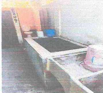
SUSITUCION DE PILA DE 2 LAVADEROS