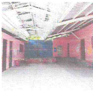
FOTOGRAFIA: SUSTITUCIÓN DE LAMINA TROQUELADA CALIBRE 26, SUMINISTRO E INSTALACION ELECTRICA DE TECHO EN ÁREA CIVICA ( 8 PLACAS CON SUS BOMBILLAS DE 100 W INCLUYE CABLE ELECTRICO, 8 TOMACORRIENTES DISTRIBUIDOS EN EL ÁREA CIVICA INCLUYE CABLE ELECTRICO, 2 APAGADORES TRIPWAY INCLUYE CABLE ELECTRICO)