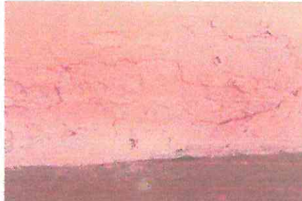
FOTOGRAFIA: REPELLO + SANITIZACIÓN EN MUROS CERNIDO EN MUROS, PINTURA EN MUROS.