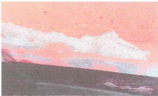
FOTOGRAFÍA: REPELLO + SANITIZACION EN MUROS CERNIDO EN MUROS, PINTURA EN MUROS.