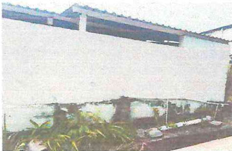
FOTOGRAFIA: REPELLO + SANITIZACIÓN EN MUROS CERNIDO EN MUROS, PINTURA EN MUROS.