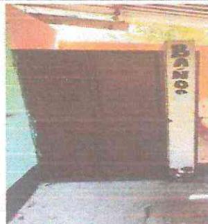
FOTOGRAFIA: REPARACION PUERTA DE BAÑO