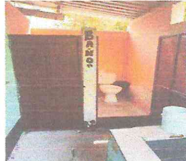
FOTOGRAFIA: ARTEFACTOS SANITARIOS INODORO