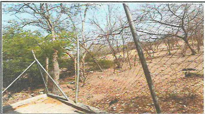
Foto 3: Sustitución de malla y tubo galvanizado en muro perimetral