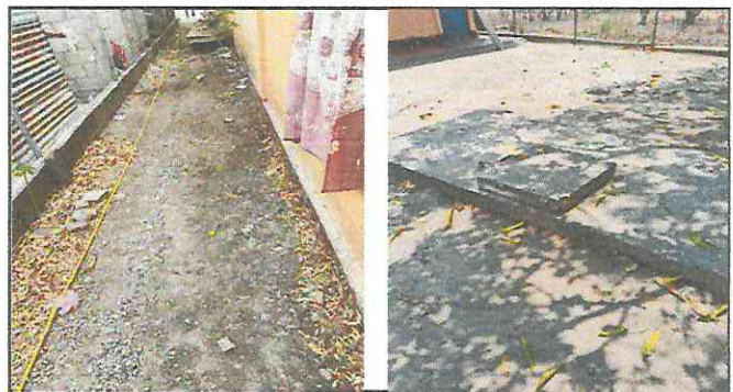
Foto 6: construcción de planchas de concreto en área recreativa y entrada principal a Parvulos.

Observación: Si es necesario se pueden agregar hojas adicionales y actualizar el número de hojas.