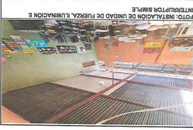
FOTO: INSTALACION DE UNIDAD DE FUERZA, ILUMINACION E INTERRUPTOR SIMPLE