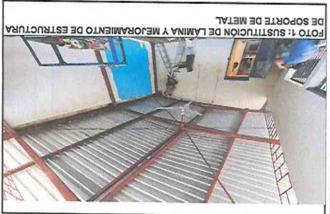
FOTO 1: SUSTITUCION DE LAMINA Y MEJORAMIENTO DE ESTRUCTURA DE SOPORTE DE METAL