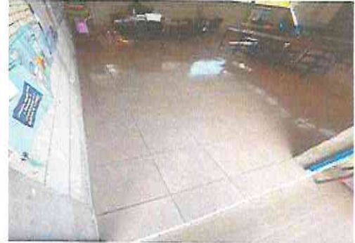
Foto 1.1. Sustitución o instalación de piso Ceramico