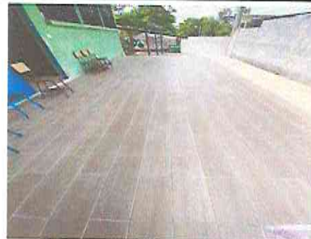
Foto 3.1. Sustitución o instalación de piso de torta de Concreto.

Observación: Si es necesario se pueden agregar hojas adicionales y actualizar el número de hojas.