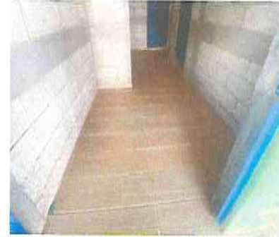
Foto 3.1. Sustitución o Instalacion de piso torta de concreto