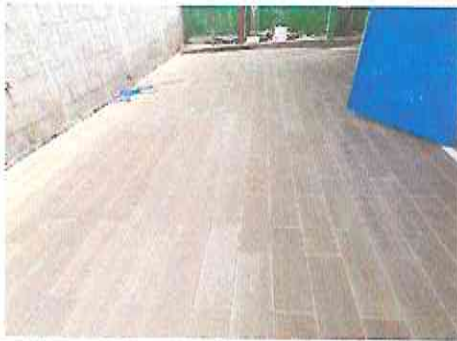
Foto 3.1. Sustitución o instalación de piso de torta de Concreto