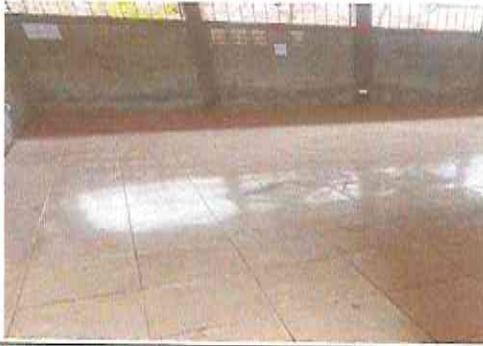
Foto 1.1. Sustitución o instalación de piso Cerámico