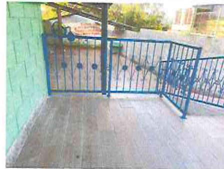
Foto 3.3. Suministro e instalación de baranda metalica en gradas

Observación: Si es necesario se pueden agregar hojas adicionales y actualizar el número de hojas.