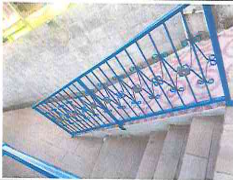
Foto 3.2 Ampliación de gradas de acceso