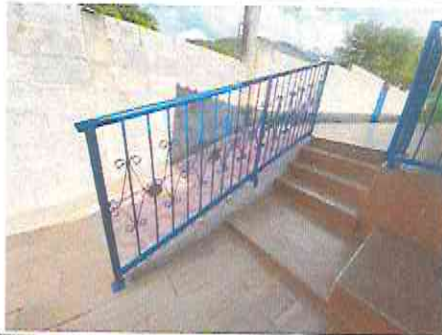
Foto 3.3. Suministro e instalación de barranda metalica en gradas