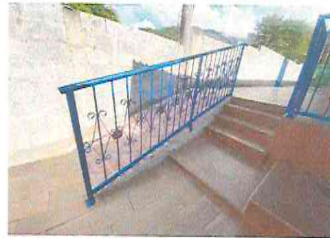
Foto 3.2. Ampliación de gradas de acceso