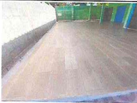
Foto 3.1. Sustitución o instalación de piso de torta de Concreto.