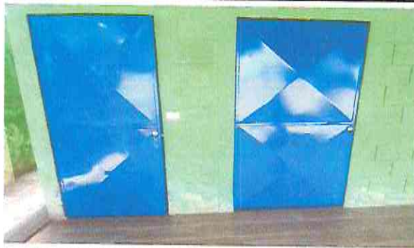
Foto 2.1. Mantenimiento a estructura puertas (lijado, cambio de tubo, cepillado, sujeciones, aplicación de pintura.)