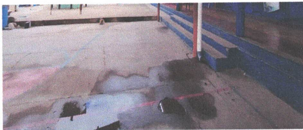
SALIDA DE TUBERIA DE AGUAS GRISES