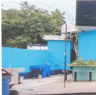
REUBIACIÓN Y FABRICACIÓN DE BASE DE CONCRETO Y ASTA DE BANDERA