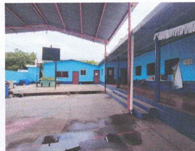
FABRICACIÓN DE CUNETETA DE CONCRETO CON REJILLA

Observación: Si es necesario se pueden agregar hojas adicionales y actualizar el número de hojas.