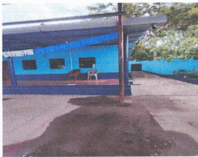
SUSTITUCIÓN DE CANAL DE METAL