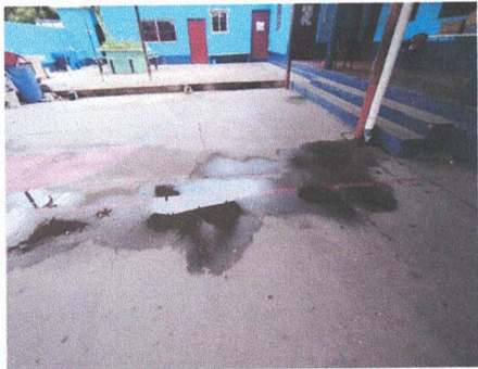
FABRICACIÓN DE CAJA DE REGISTRO DE AGUAS GRISES INCLUYE SALIDAS DE AGUA Y AMPLIACIÓN DE CONCRETO EN AREA DE INSTALACIÓN