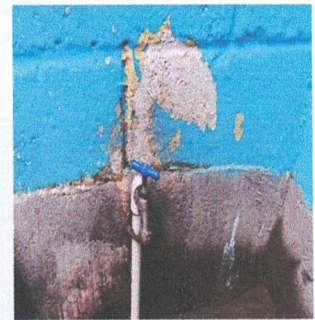
SUSTITUCIÓN DE ACCESORIO DE TANQUE Y LLAVE DE LAVAMANOS