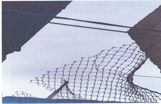
INSTALACIÓN DE MALLA GALBANIZADA EN MURO PERIMETRAL