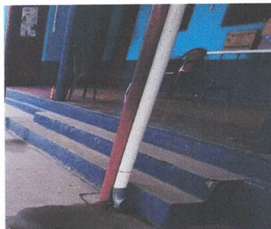
SUSTITUCIÓN DE BAJANTES DE AGUA PLUVIAL