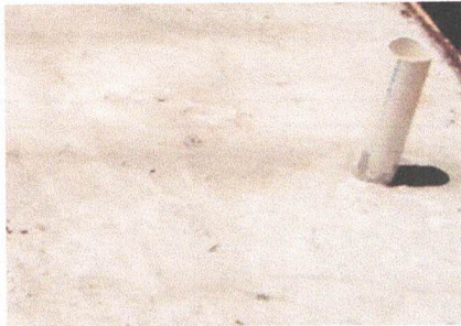
MANTENIMIENTO Y VACIADO DE FOSA SEPTICA