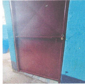
SUSTITUCIÓN DE PUERTAS DE METAL