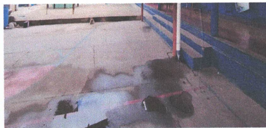
APLICACIÓN DE CONCRETO EN ÁREA DE FABRICACIÓN DE SALIDAS DE AGUA

Observación: Si es necesario se pueden agregar hojas adicionales y actualizar el número de hojas.