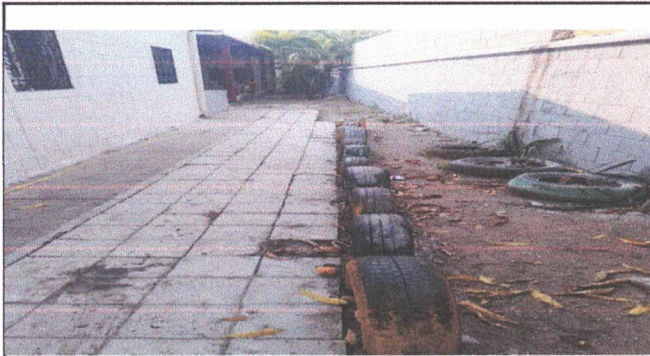
Foto1: Reparación de piso de concreto en patio