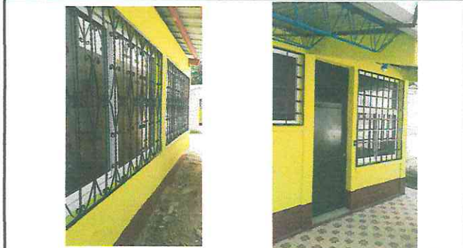
Mantenimiento de bálcoles, en el piso de cemento colocación de piso sserámico en el aula, se colocará piso seraámico en la cocina porque es torta de cemento, todo con su material.