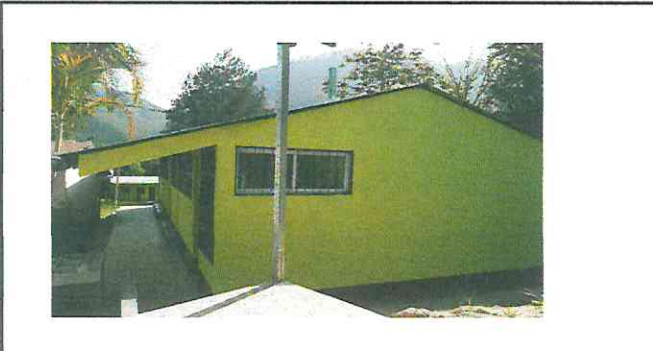
Se mandará a hacer una ventana en la bodega de la cocina para tener ventilación incluyendo ventana pvc, balcon, repello en muros de contención, se repellara una pared en un aula de primara por filtración.