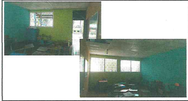
22.3. Aplicación de repello de número de contención aula.

Observación: Si es necesario se pueden agregar hojas adicionales y actualizar el número de hojas.