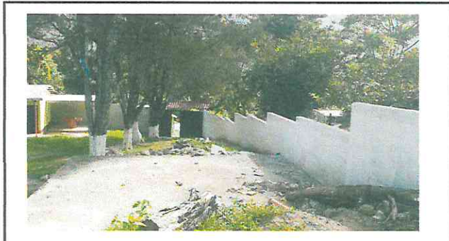
Se levantará muro perimetral alrededor de la escuela, debido a que ingresan personas ajenas a las instalaciones a robar por tener muy bajo el tapial.