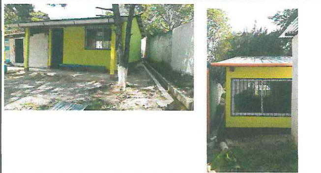
Sustitución de unas laminas deterioradas, cambio de ventanas pvc