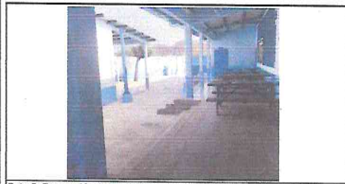
Foto 5: Reparación Aulas, Cocina, Corredor y Bodega. (Reparación de Rampas de Acceso dañadas en Puntos Varios).