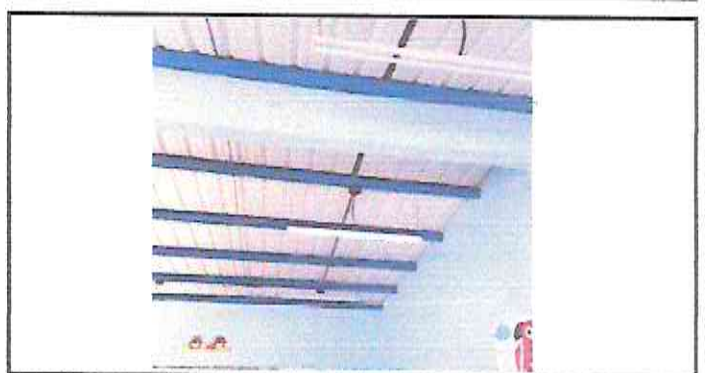
Foto 6: Reparación Aulas, Cocina, Corredor y Bodega. (Sustitución de focos ahorradores y Revisión de falla eléctrica).

Observación: Si es necesario se pueden agregar hojas adicionales y actualizar el número de hojas.