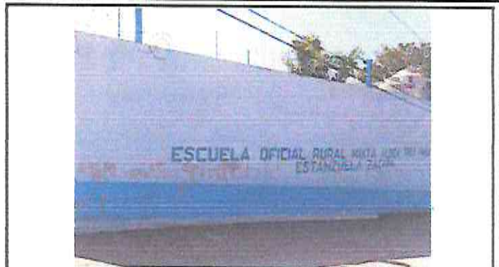
Foto 2: Reparación en Muro Perimetral. (Mantenimiento a Portón, Aplicación de pintura en interiores y exteriores; y Rotulo de la Escuela).