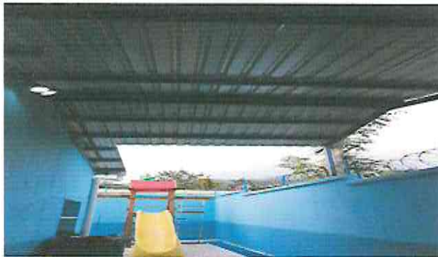
Foto 3: Sustitución o instalación de lámina por lámina troquelada calibre 26.