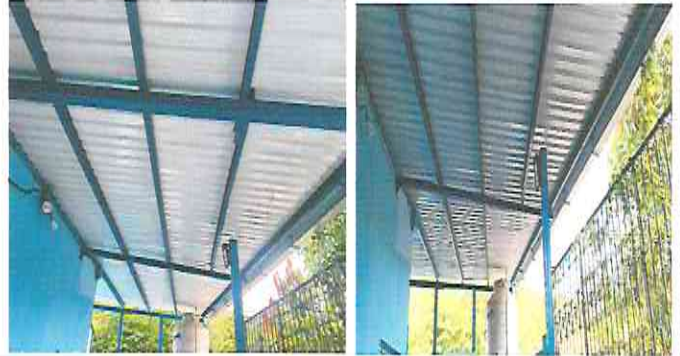
Foto 2: Sustitución o instalación de lámina entre área de comedor y pasillo a la cocina, por lámina troquelada calibre 26.