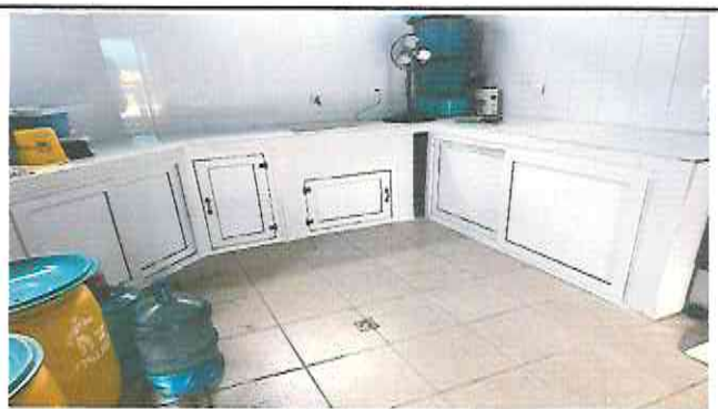
Foto 6: Sustitución o instalación de puertas para muebles de cocina.

Observación: Si es necesario se pueden agregar hojas adicionales y actualizar el número de hojas.