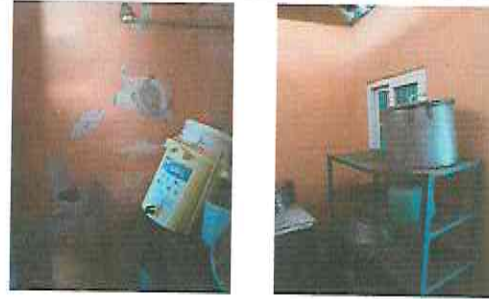
Foto 2: Cocina, reparación de muros, cambio de repisas en muro, instalación de electricidad y pintura.