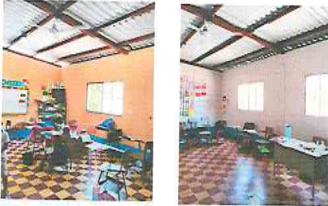
Foto 1: Área de aulas sustitución de ventanas por PVC, cambio de ventiladores inservibles y pintura general.