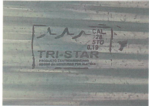
Foto 2: Lámina Acanalada NO CUMPLE NORMAS Y ESPECIFICACIONES DE OBRA DE MINEDUC.