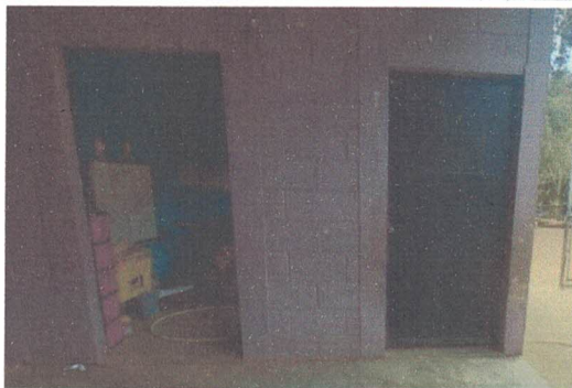
Foto 5: Mantenimiento Correctivo a Puertas de Metal con Lijar, quitar Pintura y Aplicar 2 MANOS DE PINTURA ANTICORROSIVA COLOR SEGÚN SUPERVISOR.