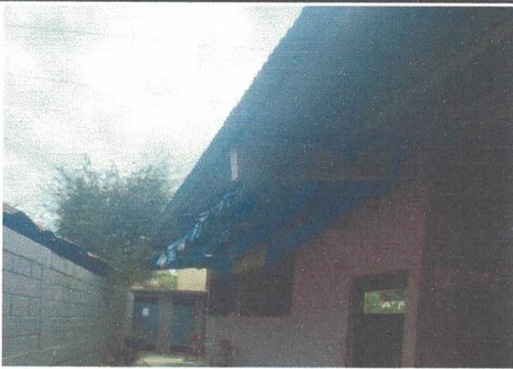
Foto 3: Posterior al Mantenimiento de Costaneras y Sustitución de Lámina Troquelada de Aluzinc. Se Instalará Canal Pluvial Metálico Interno, con Pezcantos y Tubería PVC.Ø3" para Bajadas de Aguas Pluviales.