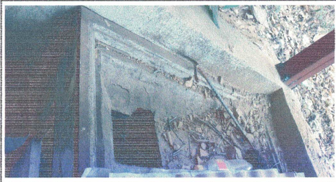
Arreglo de polleton o cocina