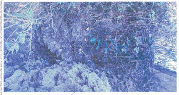
Muro de contención