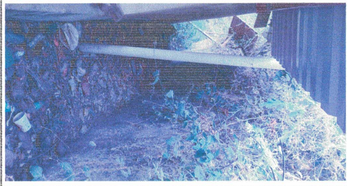
caida de agua