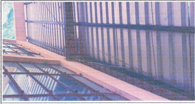
Arreglo de servicio electrico

Observación: Si es necesario se pueden agregar hojas adicionales y actualizar el número de hojas.