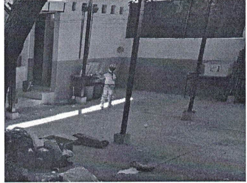
Foto 2: área en donde se ubicaran los lavamanos y el mueble de concreto.