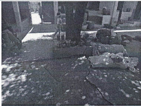
Foto 3: patio dañado que necesita reparación y sustitución de piso.