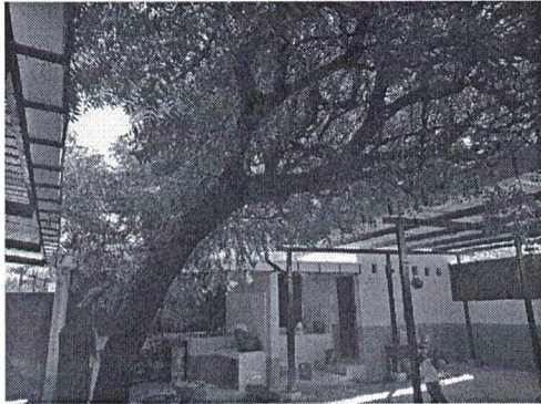
Foto 1: árbol que esta causando daños en el piso del establecimiento que deberá ser demolido, así mismo es el área en donde se instalara techo metálico para evitar soleamiento y tener espacio para juegos.