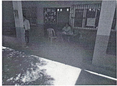
Foto 4: en esta área ingresa el agua de lluvia ya que la escorrentía corre hacia este punto, se instalara caja colectora con rejilla para conducir la misma al exterior.