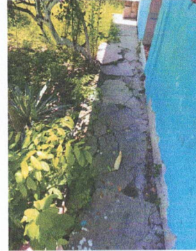
Foto 2: Reparación de la acera para protección de la pared del aula.