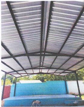
Foto 3: Necesitamos la Instalación de iluminación para área de escenario e instalación de tomacorrientes.