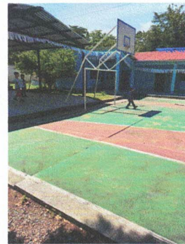
Foto 4: Sustitución de planchas de concreto de cancha (DEMOLICIÓN Y FUNDICIÓN).