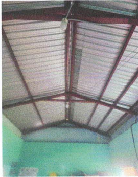
Foto 1: Es importante la Instalación de cielo falso para mejorar el clima dentro del aula.