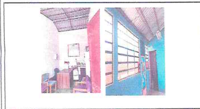
FOTO 3: Aplicación de pintura interior y exterior en las instalaciones.