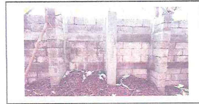
Foto 6: Reparacion de columnas de soporte para muro de contencion.

Observación: Si es necesario se pueden agregar hojas adicionales y actualizar el número de hojas.