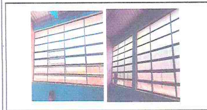
Foto 5: Fabricacion y colocacion de Balcones para las aulas de las instalaciones.