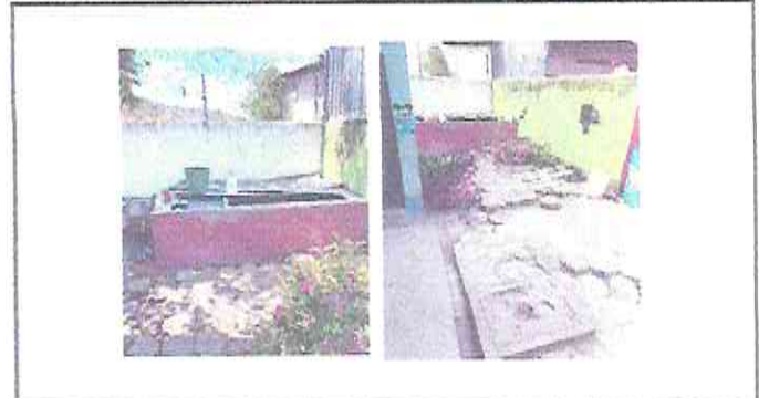
FOTO 2: Mantenimiento de estructura de techo para el area de pila.