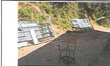
Foto 3: Desmontaje de Balcones tipo FIS en Mal Estado y Puertas en Mal Estado.