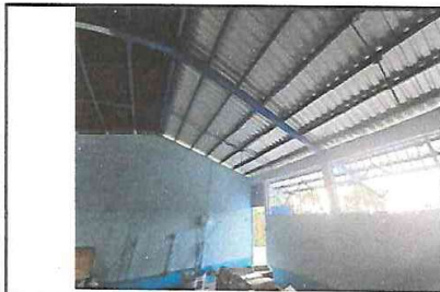
Foto 5: Reparación de Cubierta de Techo. Debe Removerse la Lámina de Asbesto cemento para darle Mantenimiento a la Estructura Existente y Luego Sustituir Lámina Troquelada C26 Legítima. Retiro y Sustitución de Puerta y Balcones. Suministro de Pintura Latex. (VISTA ISOMETRICA POSTERIOR AULA PURA).