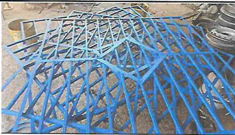
Foto 9: Aplicación de Pintura Anticorrosiva en Talleres para trasladarlos hacia EORM. ALDEA CERRO PELÓN.