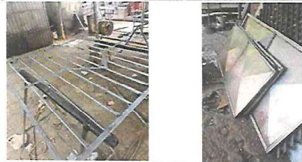
Foto 8: Trabajo de Herrería en Talleres de Balcones de Metal y Puertas de Metal, para trasladar a EORM. ALDEA CERRO PELÓN.