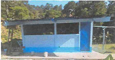
Foto 7: Reparación de Cubierta de Techo. Debe Removerse la Lámina de Aasbeato cemento para darle Mantenimiento a la Estructura Existente y Luego Sustituir Lámina Troquelada C26 Legítima. Retiro y Sustitución de Puerta y Balcones. Suministro de Pintura Latex. (VISTA ISOMETRICA POSTERIOR AULA PURA).