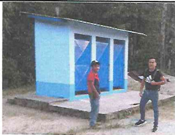
Foto 11: Verificación de Avance conjuntamente entre Director de EORM. ALDEA CERRO PELÓN y Proveedor MODULO DE SERVICIO SANITARIO CON LETRINA DE HOYO SECO.