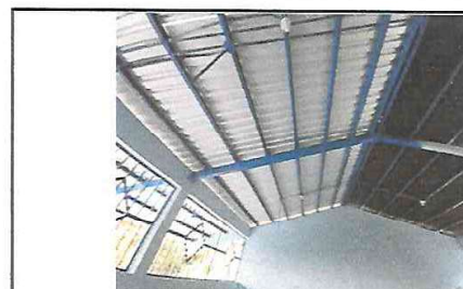
Foto 6: Reparación de Cubierta de Techo. Debe Removerse la Lámina de Asbesto cemento para darle Mantenimiento a la Estructura Existente y Luego Sustituir Lámina Troquelada C26 Legítima. Retiro y Sustitución de Puerta y Balcones. Suministro de Pintura Latex. (VISTA ISOMETRICA POSTERIOR AULA PURA).

Observación: Si es necesario se pueden agregar hojas adicionales y actualizar el número de hojas.