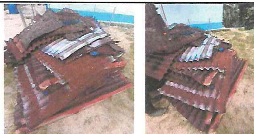
Foto 10: Retiro de Lámina en Pesimo Estado. De AULA PURA y de SERVICIOS SANITARIOS DE LETRINA TRADICIONAL DE HOYO SECO.