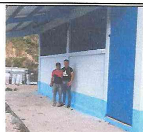
Foto 12: Verificación de Avance conjuntamente entre Director de EORM. ALDEA CERRO PELÓN y Proveedor AULA PURA.

Observación: Si es necesario se pueden agregar hojas adicionales y actualizar el número de hojas.