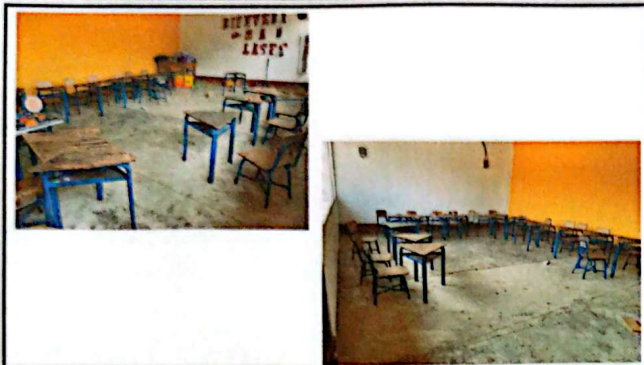
Foto1: Sustitución o instación de piso cerámico.