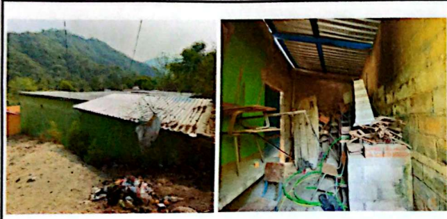
Foto 3: Cambio de lamina, repación de repello y cernido de paredes, sustitución o instalación de piso ceramico.