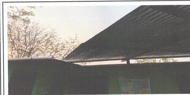
SUSTITUCION DE LAMINA POR LAMINA TROQUELADA ALUZINC CALIBRE 26