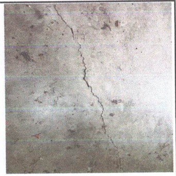
REPARACION PLANCHA DE CONCRETO