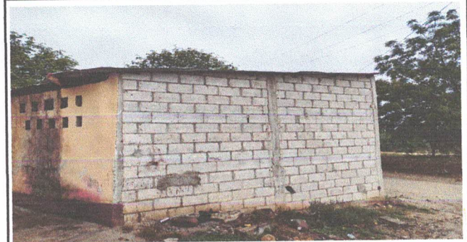
REPELLO EN MURO