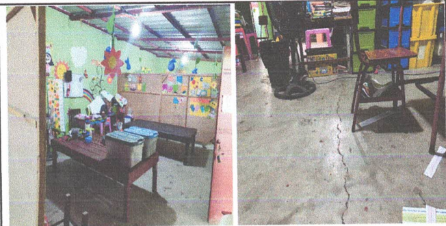
SUSTITUCION DE PISO CERAMICO