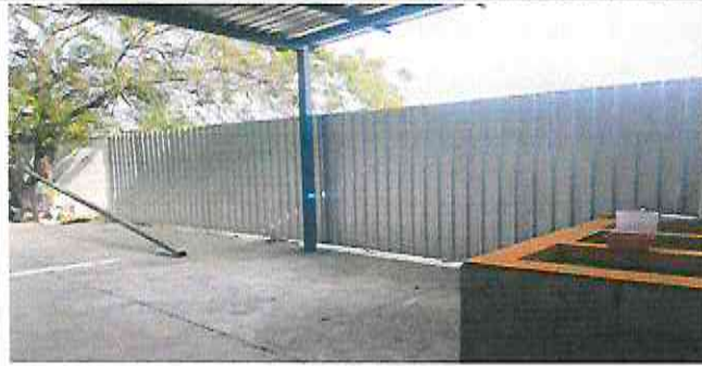
REFUERZO DEMAYA EXISTENTE POR LAMINA REGLON 1.1