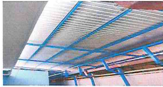
INSTALACION DE LAMINA POR LAMINA TROQUELADA ALUCINCELA CALIBRE 26 REGLON 1.2