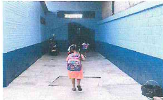
PINTADO DE MUROS ESTERIORES E INTERIORES REGLON. 2.1