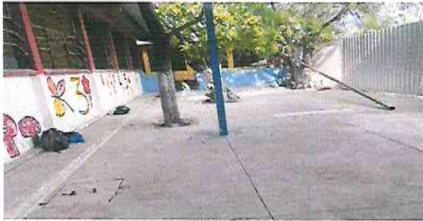
REGLON 4.1 SUSTITUCION DE PLANCHA DE CONCRETO