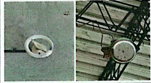
SUSTITUCIÓN DE LAMPARAS TIPO LED, SUSTITUCIÓN DE TIMBRE Y REPARACIÓN DE CABLEADO ELÉCTRICO. ✓