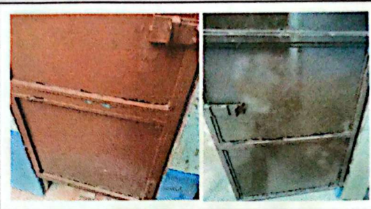
MANTENIMIENTO A ESTRUCTURA DE PUERTA (LIJADO, CEPILLADO, APLICACIÓN DE PINTURA, SUJECIONES) ✓