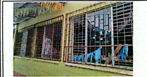
MANTENIMIENTOS DE BALONES DE METAL ✓