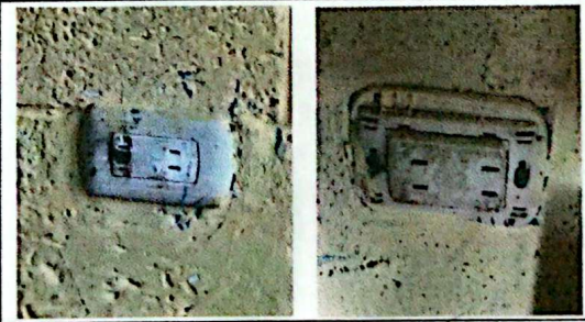
SUSTITUCIÓN DE TOMACORRIENTES DOBLES ✓

Observación: Si es necesario se pueden agregar hojas adicionales y actualizar el número de hojas.