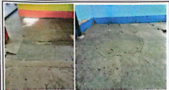
SUSTITUCIÓN DE PISO DE CEMENTO A PISO CERÁMICO ✓