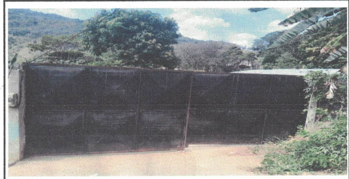
Matenimiento y chapa para porton principal

Observación: Si es necesario se pueden agregar hojas adicionales y actualizar el número de hojas.