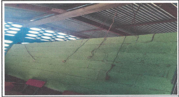
Alumbrado en aulas y suministros.