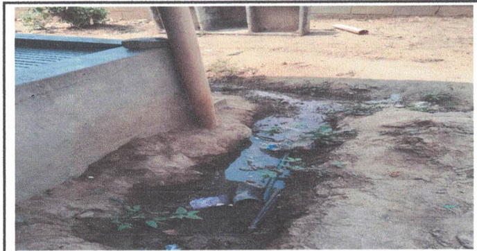
Instalacion de pila y suministro