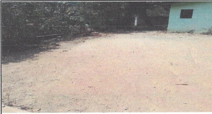
Pavimento en patios.