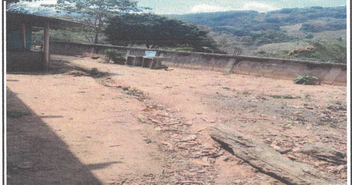
Instalacion de tragante y tubería para drenaje.