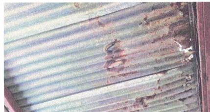
2.2 sustitucion de lamina por lamina troquelada aluzinc con tornilleria de fijacion