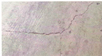
3.1 reparacion de piso de torta de concreto