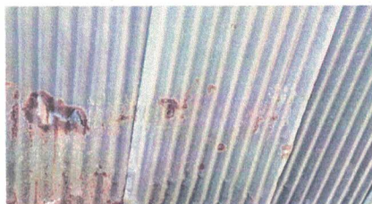
2.2 sustitucion de lamina por lamina troquelada aluzinc con tornilleria de fijacion