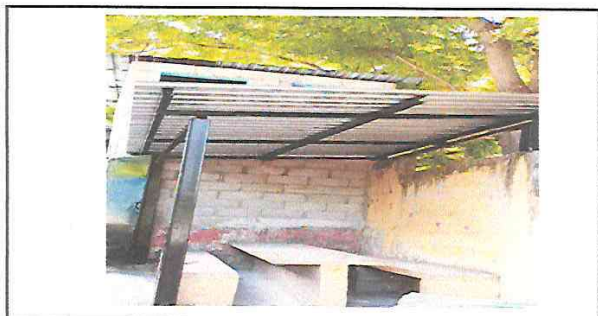
ESTRUCTURA DE METAL Y CUBIERTA TERMINADA.