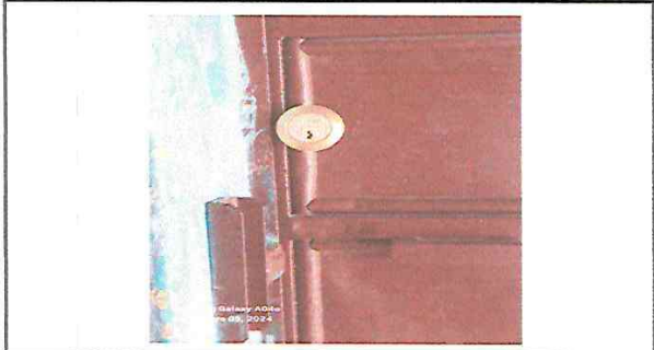
INSTALACION DE CHAPAS FINALIZADO