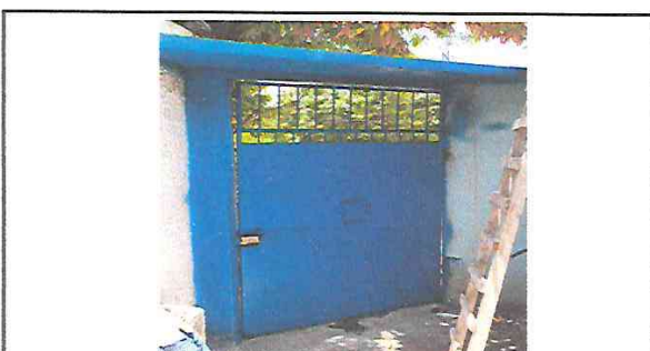
MANTENIMIENTO A PORTÓN FINALIZADO

Observación: Si es necesario se pueden agregar hojas adicionales y actualizar el número de Hojas.