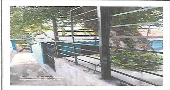
MANTENIMIENTO DE BARANDAS TERMINADO