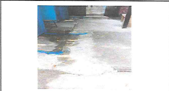
TORTA DE CEMENTO DE PATIO FINALIZADA