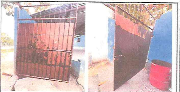
SUSTITUCION DE PUERTA

Observación: Si es necesario se pueden agregar hojas adicionales y actualizar el número de hojas.