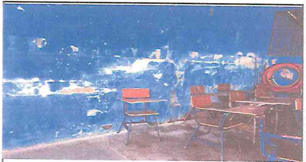
SUSTITUCION DE PISO CERAMICO