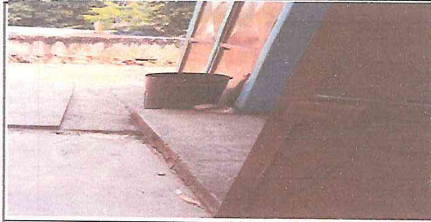
SUSTITUCION DE CHAPAS