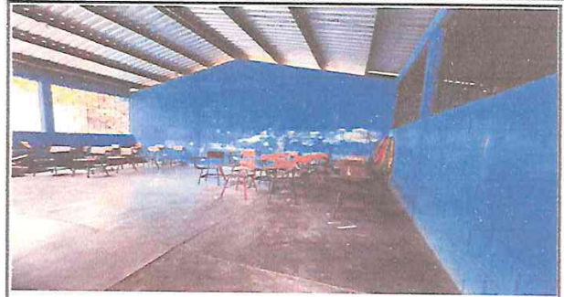
MANTENIMIENTO A BALCONES DE METAL