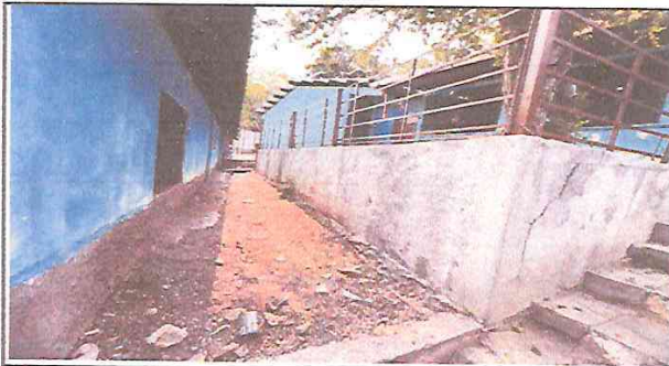
ALISADO EN MURO