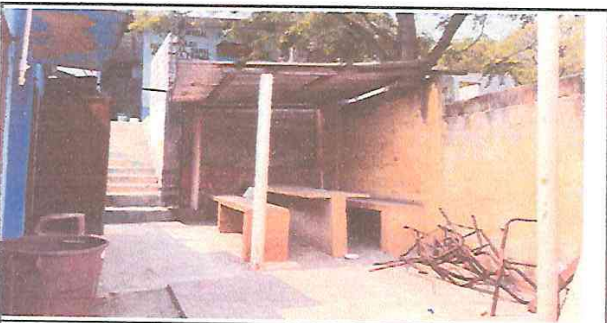
CERNIDO EN MURO