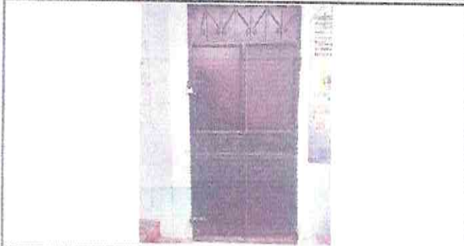
Foto 7: Mantenimiento a estructura (lijado, cambio de tubo, cepillado, sujeciones, aplicación de pintura) Puertas