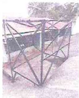
Foto 17: Mantenimiento a estructura metálica de la base del depósito.