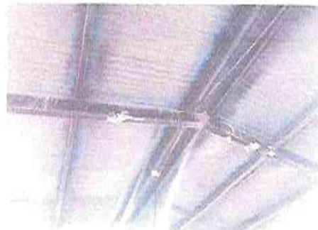
Foto 14: Mantenimiento a estructura de soporte de metal, Costaneras