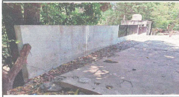
MEJORAMIENTO DE MURO PERIMETRAL DE BLOCK Y MEJORAMIENTO DE MALLA GALVANIZADA