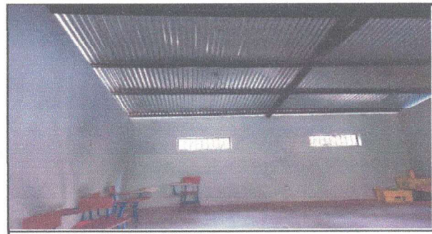
PINTURA DEL AULA POR ADENTRO

Observación: Si es necesario se pueden agregar hojas adicionales y actualizar el número de hojas.