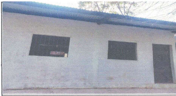
PINTURA DEL AULA AFUERA