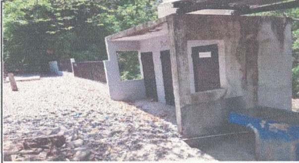
MEJORAMIENTO DE MURO PERIMETRAL DE BLOCK Y MEJORAMIENTO DE MALLA GALVANIZA