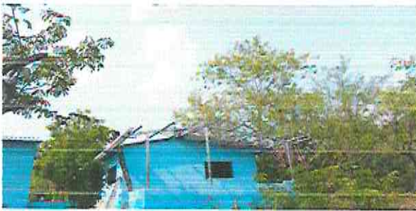
FOTO 9 INSTALACIÓN DE ESTRUCTURA METALICA