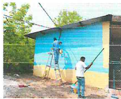
FOTO 10 PINTURA EXTERIO