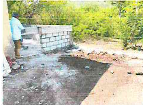
FOTO 2 REPARACIÓN DE MURO DE CONTENCIÓN