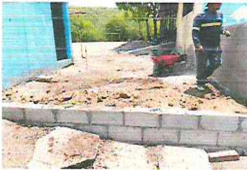
FOTO 3 SUSTITUCIÓN DE PISO DE TORTA Y REPARACIÓN DE MURO DE CONTENCIÓN