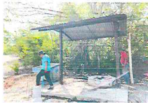
FOTO 4 REPARACIÓN TUBO HG Y MALLA GALBANIZADA