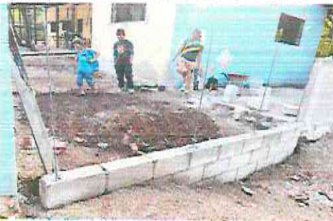
FOTO 11 REPARACIÓN DE MURO CODNTENCIÓN