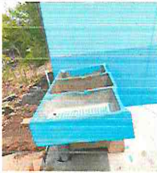
FOTO 7 INSTALACIÓN DE PILA