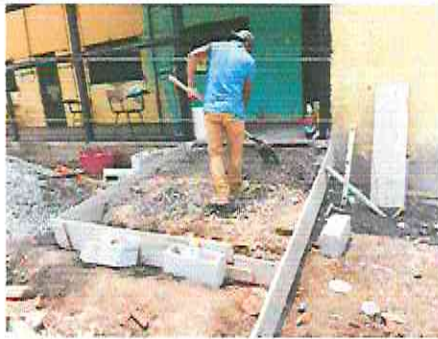
FOTO 1 REPARACIÓN DE RAMPA