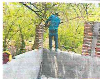
FOTO 12 CERNIDO EN MURO APLICACIÓN DE SABIETA; REPARACIÓN DE MURO PERIMETRAL

Observación: Si es necesario se pueden agregar hojas adicionales y actualizar el número de hojas.