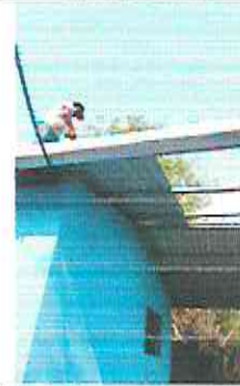
FOTO 8 INSTALACIÓN DE LÁMINA