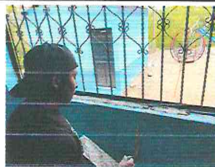
FOTO 6 INSTALACIÓN DE VENTANAS PVC

Observación: Si es necesario se pueden agregar hojas adicionales y actualizar el número de hojas.