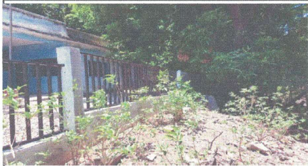
MEJORAMIENTO DE MURO PERIMETRAL DE BLOCK Y MEJORAMIENTO DE MALLA GALVANIZADA