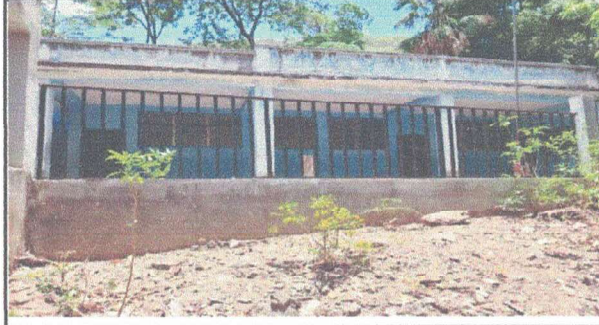
MEJORAMIENTO DE MURO PERIMETRAL DE BLOCK Y MEJORAMIENTO DE MALLA GALVANIZADA