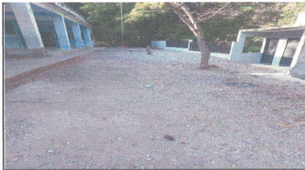
REPARACION DE LOSA DE CONCRETO DE PATIO