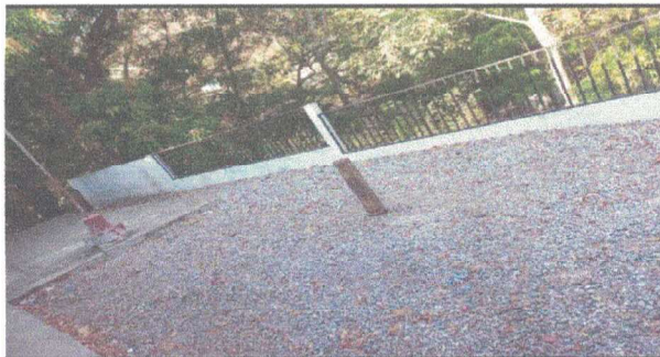
REPARACION DE LOSA DE CONCRETO DE PATIO

Observación: Si es necesario se pueden agregar hojas adicionales y actualizar el número de hojas.