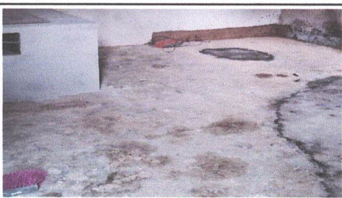
PLANCHA DE CONCRETO DE COCINA

Observación: Si es necesario se pueden agregar hojas adicionales y actualizar el número de hojas.