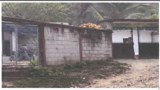
PINTURA EN MUROS EXTERIORES E INTERIORES