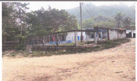
REPARACION DE MUROS PERIMETRAL DE BLOCK