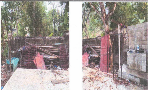
REPELLO EN MURO GRIS