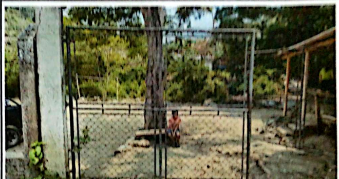
Foto 4: Mantenimiento de estructura (lijado, cambio de tubo, sujetiones, aplicación de pintura).