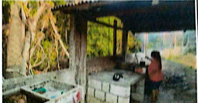
Foto 2: Sustitución de estructura de soporte de madera por metal.