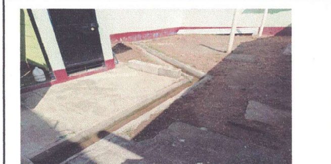
sustitucion piso de torta de concreto