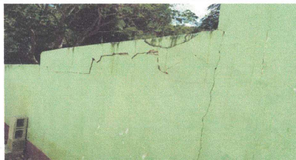
repello en muros

Observación: Si es necesario se pueden agregar hojas adicionales y actualizar el número de hojas.