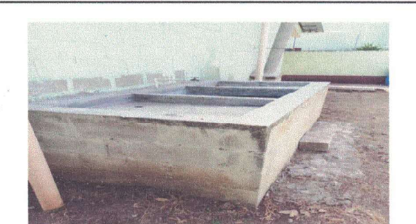
Reparacion de sistema de concreto

Observación: Si es necesario se pueden agregar hojas adicionales y actualizar el número de hojas.