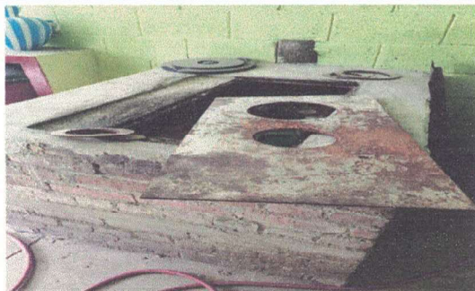
susstitucion de plancha de metal