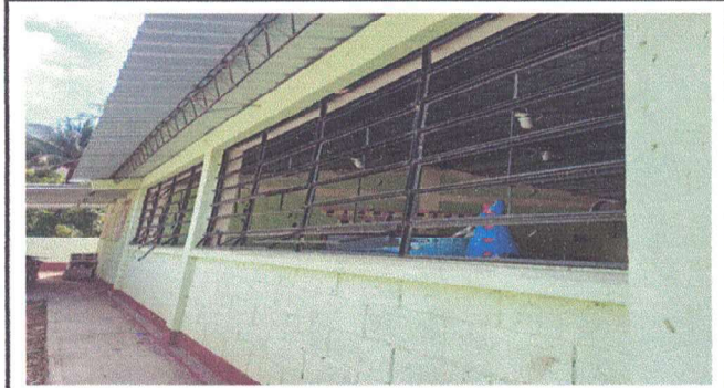
sustitucion de vidrios