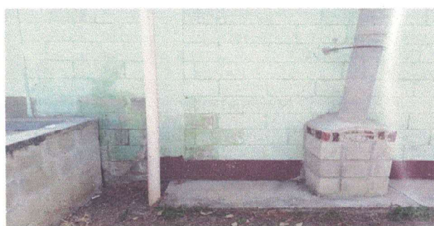
Instalacion de lavamanos