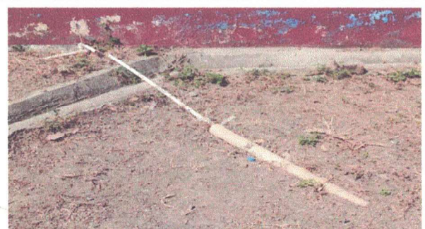
sustitucion de tuberia lineal principal