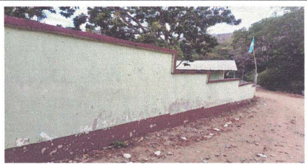
pintura en muros exterior e interior