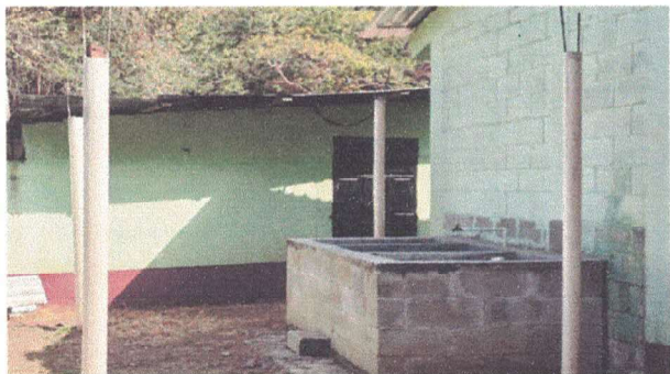
instalacion de estructura y lamina