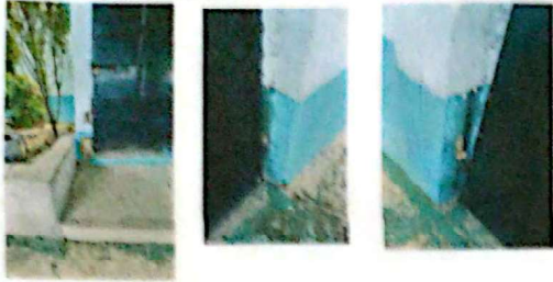
Foto1: mantenimiento de estructura