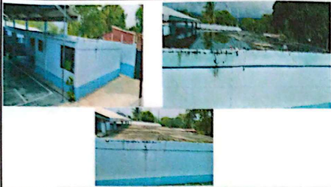
Foto1: impermeabilización de losa