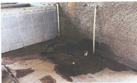
SUSTITUCIÓN DE TUBERÍA DE DRENAJE