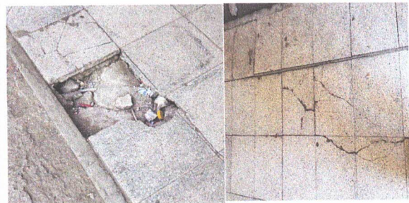
SUSTITUCIÓN DE PISO DE GRANITO A PISO LIQUIDO

Observación: Si es necesario se pueden agregar hojas adicionales y actualizar el número de hojas.