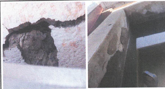
REPARACION Y MANTENIMIENTO DE CISTERNAS