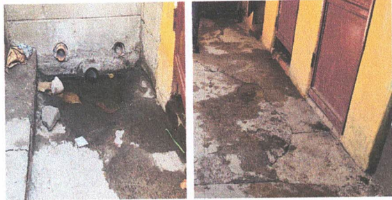
SANAMIENTO DE LOSA DE PATIO