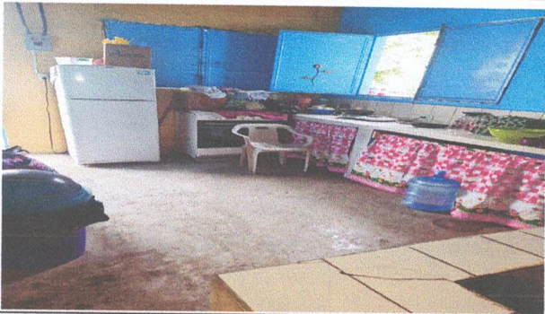
Foto 3: SUSTITUCION DE TORTA DE CEMENTO POR PISO CERAMICO Y REPARACION DE VENTANAS