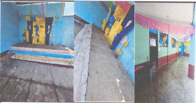
Foto 5: ESCENARIO Y PINTURA EXTERIOR E INTERIOR AULAS Y ESCENARIO