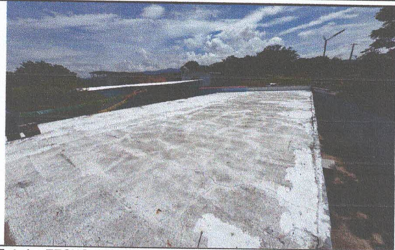
Foto1: TECHO MODULO 1 FABRICACION DE ESTRUCTURA DE TECHO Y LAMINA