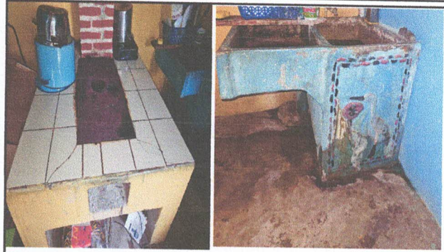
Foto 2: COCINA. SUSTITUCION DE PILA DE CEMENTO MANTENIMIENTO Y PLANCHA DE COCINA RURAL