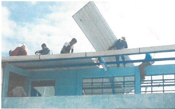
Foto1: Vista de cambio de lámina