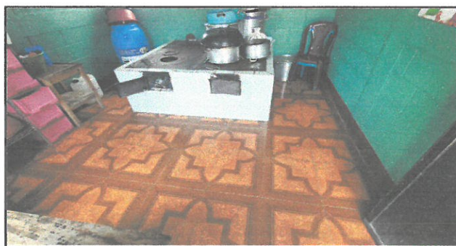
Cambio de piso de cocina y remozamiento de plancha.