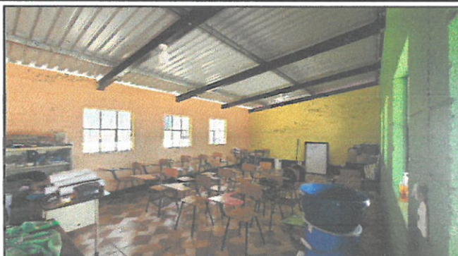
Pintura de aula 1, cambio de piso y cambio de circuito eléctrico.