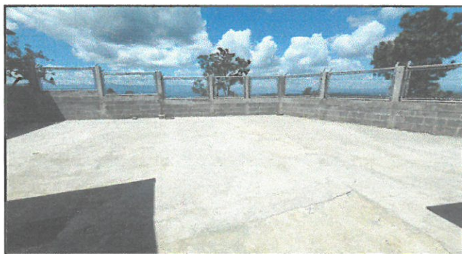
Remozamiento de piso de concreto.