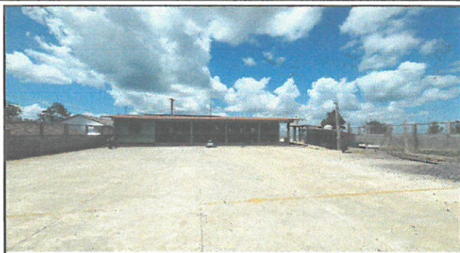
Pintura por fuera de la escuela y cambio de canaletas.