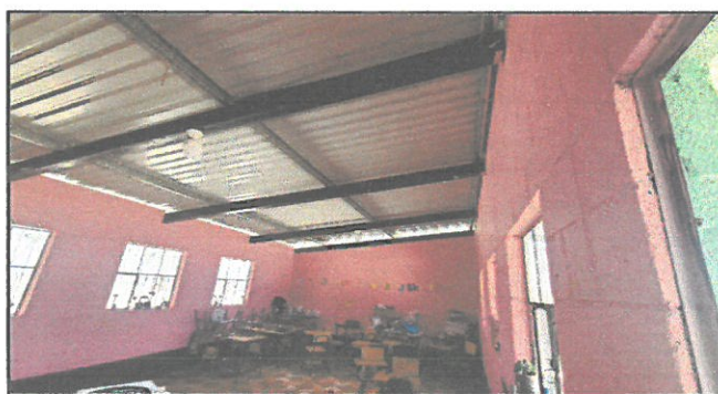
Pintura de aula 2, cambio de piso y cambio de circuito eléctrico.

Observación: Si es necesario se pueden agregar hojas adicionales y actualizar el número de hojas.