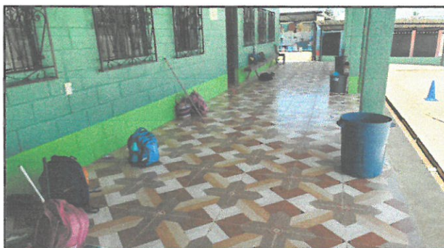
Pintura en corredor de escuela y cambio de piso.