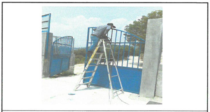
En proceso de mantenimiento del portón de 2 hojas mas su pintura.

Observación: Si es necesario se pueden agregar hojas adicionales y actualizar el número de hojas.