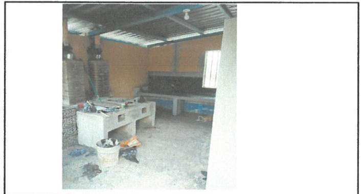
Vista del piso de cemento en proceso de sustitucion, por piso de porcelanato.