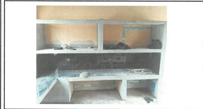
Vista del desayunoador con su nueva modificación