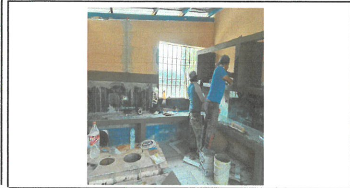
Vista de la plancha en su proceso de modificación.