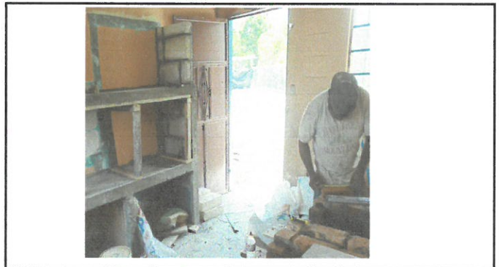
Vista de la puerta en su proceso de mantenimiento.